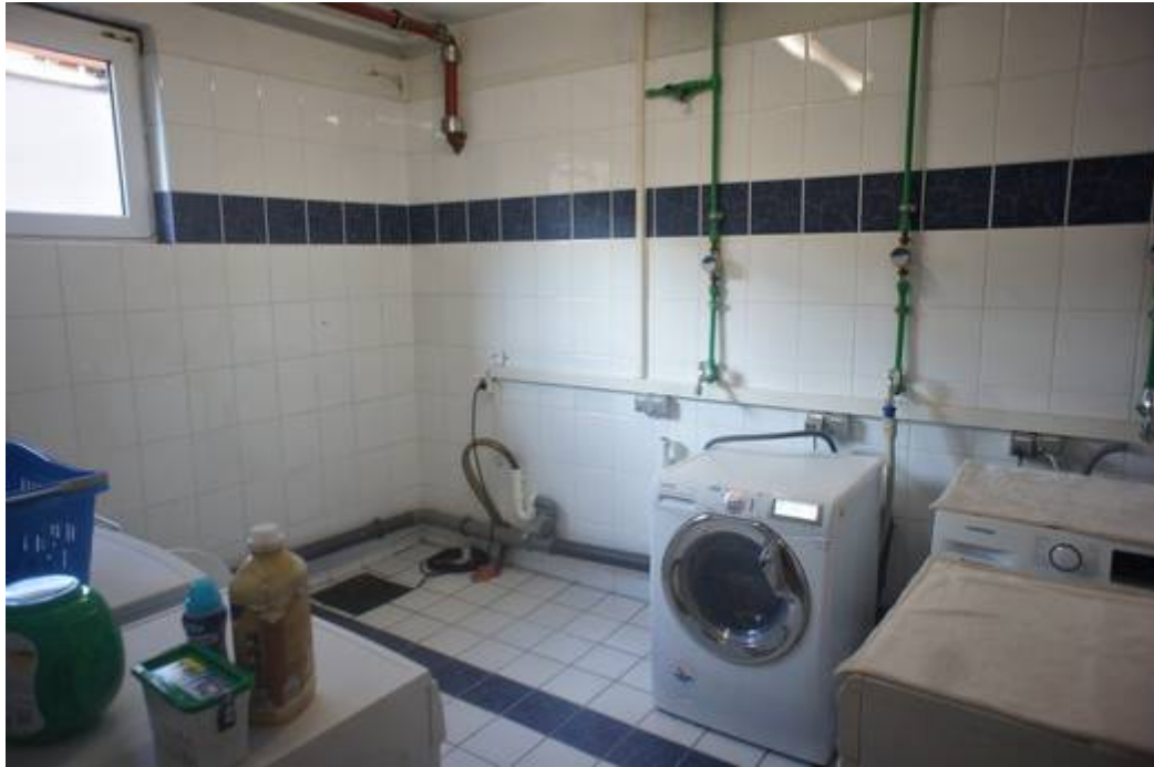
Waschraum im Keller