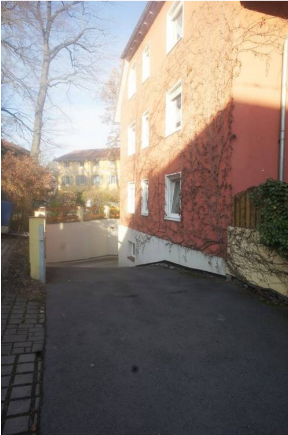
Einfahrt zur Tiefgarage