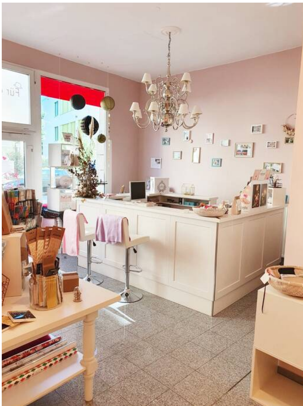
Kassenbereich / Tresen