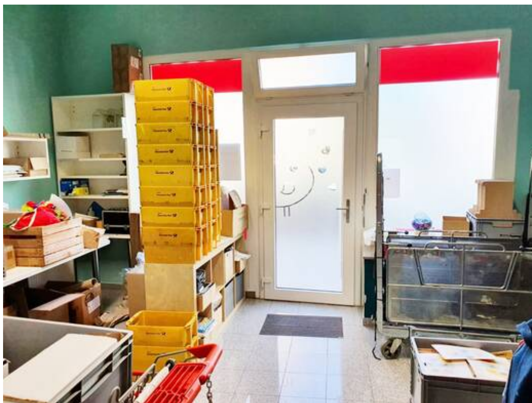
Eingang 2 von innen