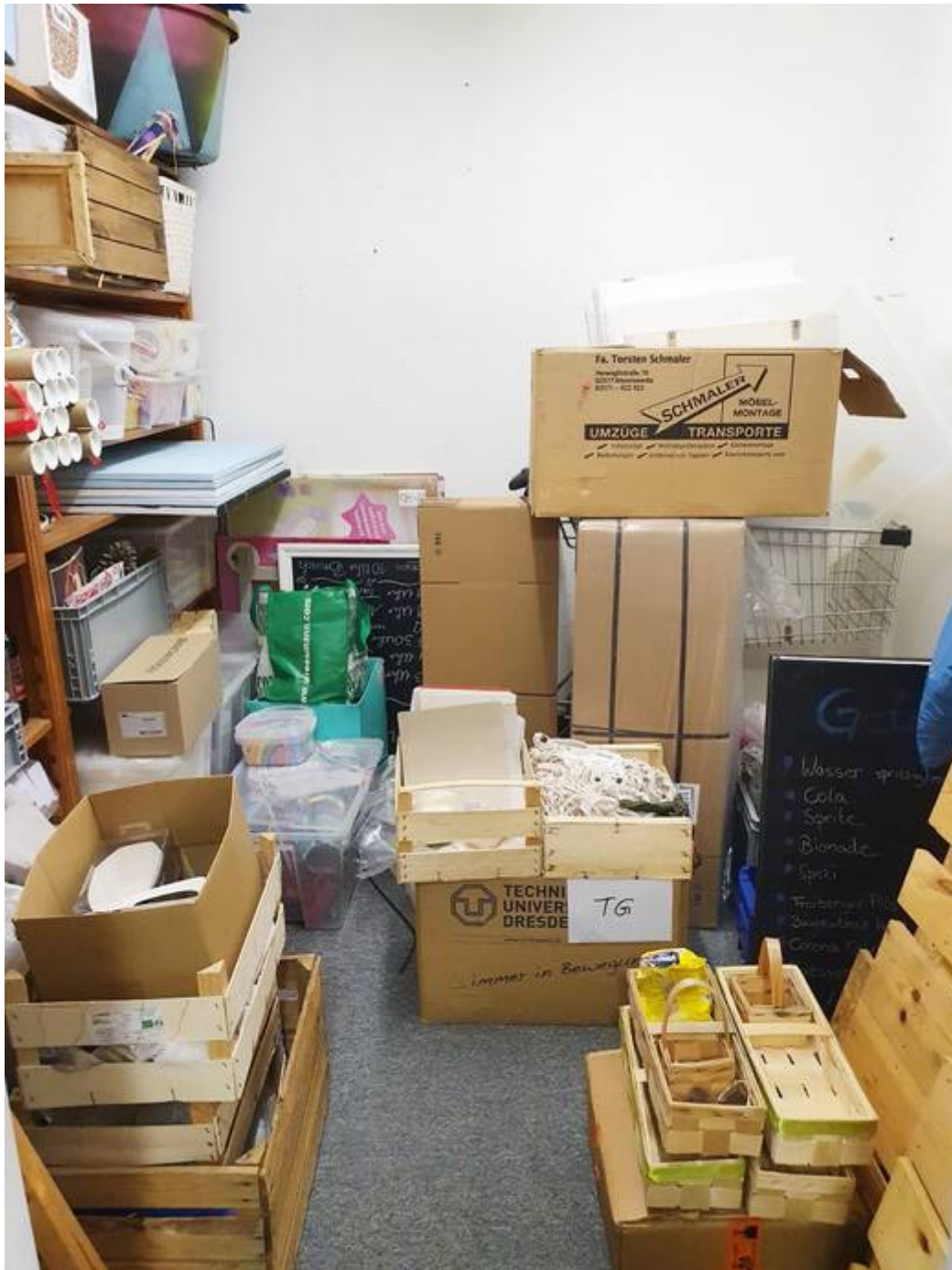
kleines Lager UG