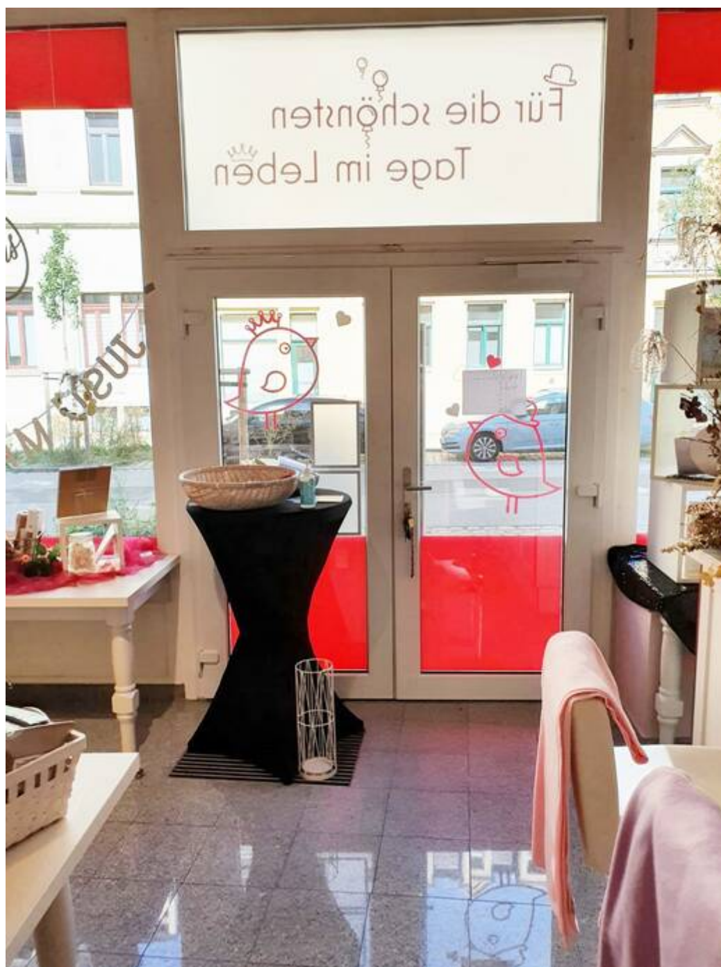
Eingang 1 von innen