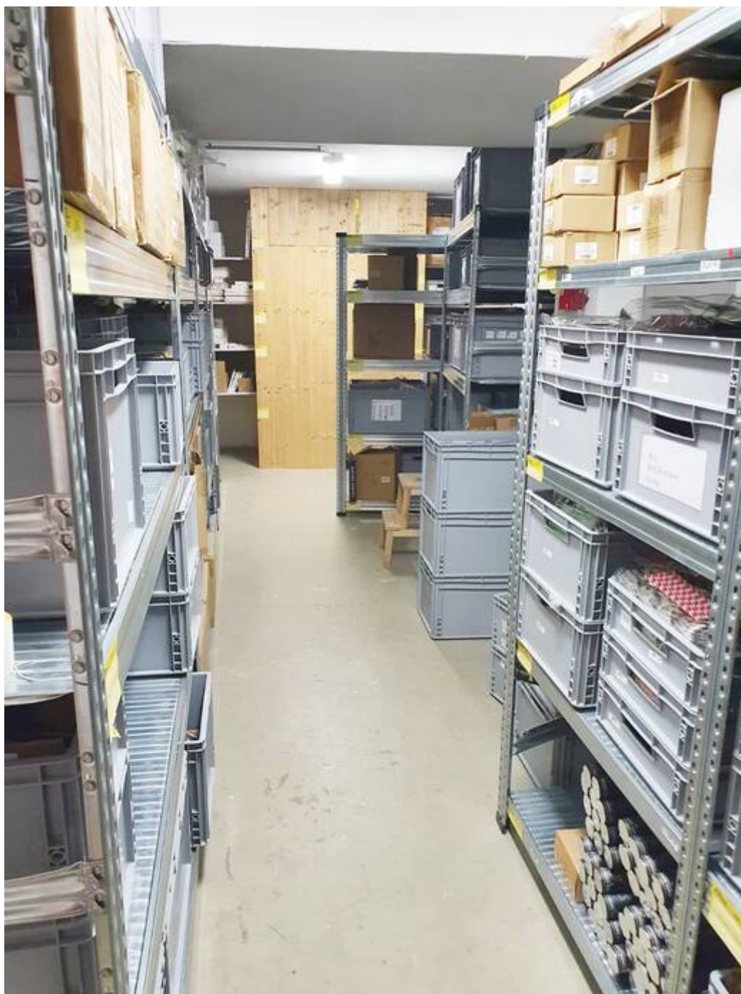
großes Lager UG