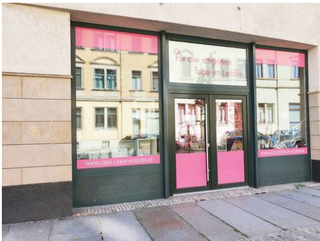
Haupteingang / Eingang 1