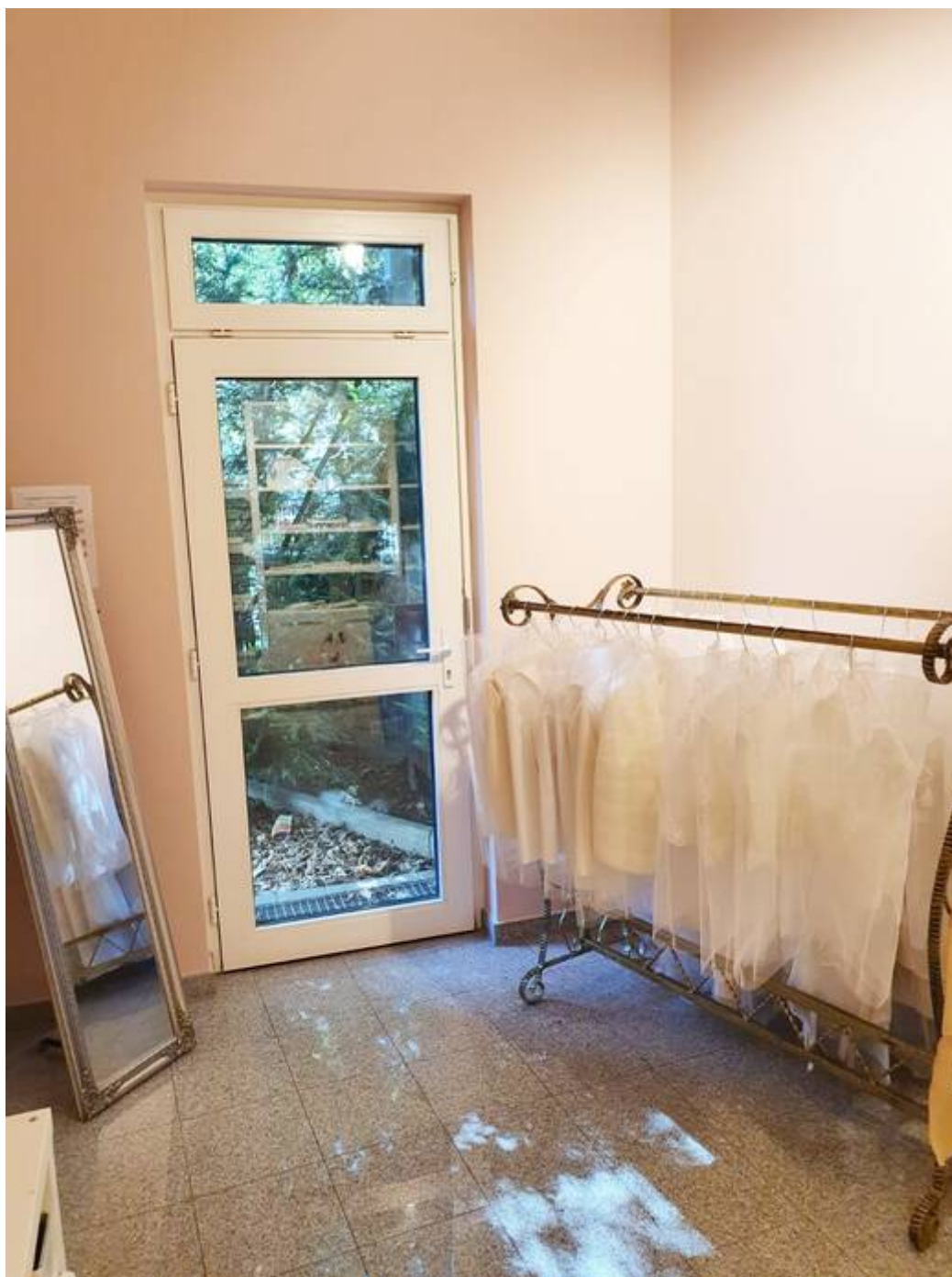
Tür zum Innenhof EG