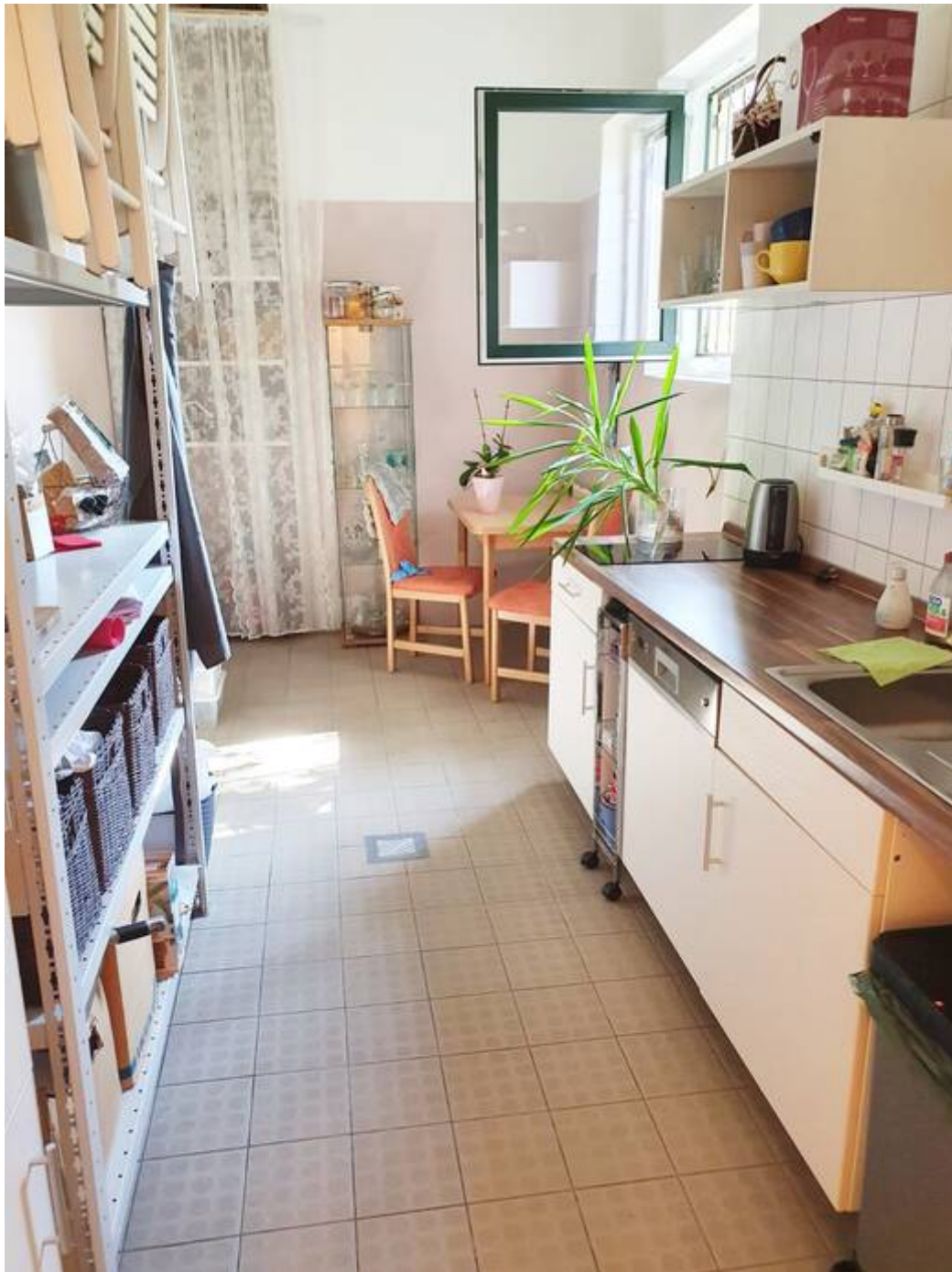
großzügiger Küchenbereich EG