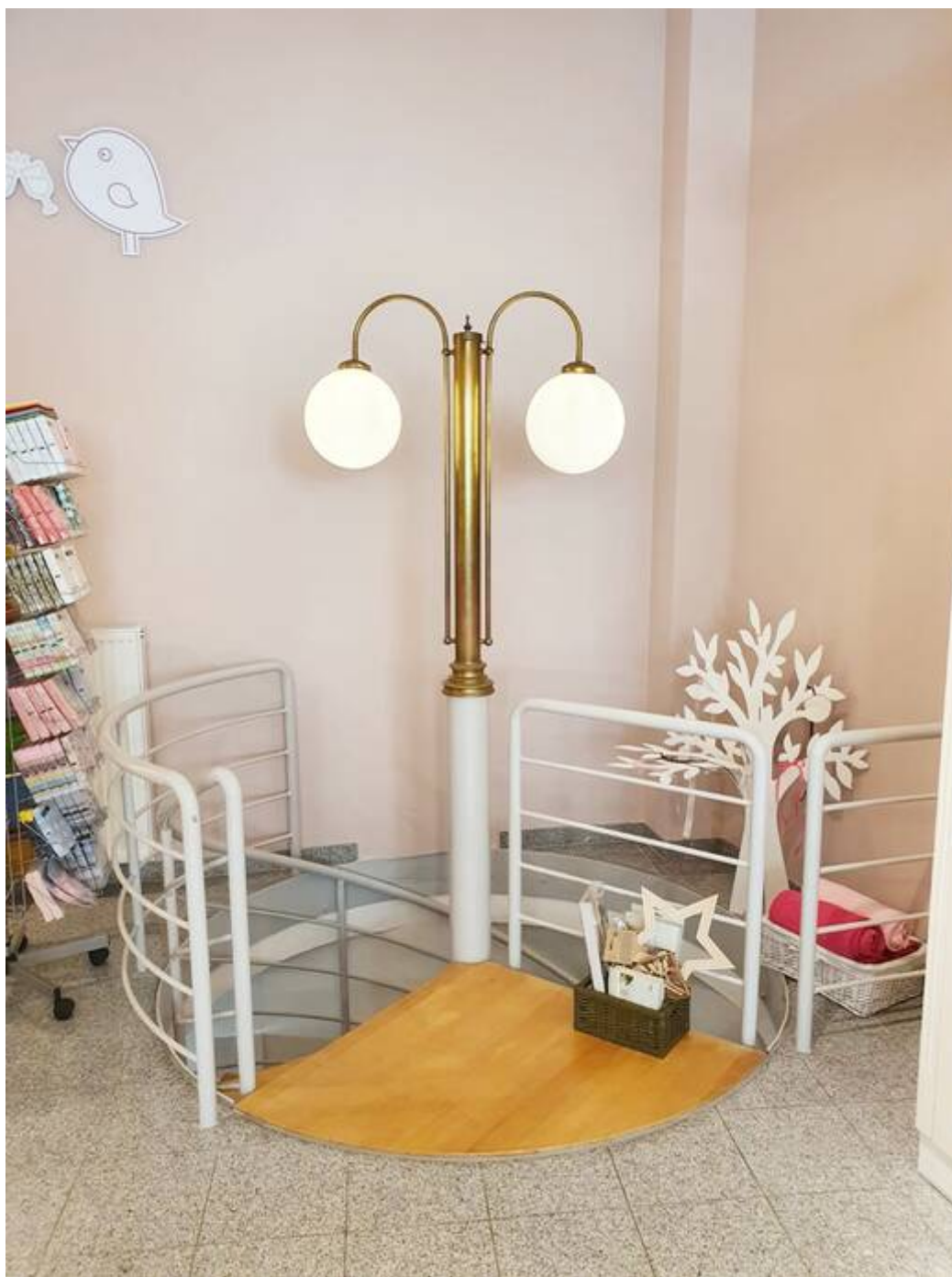
Zugang zum UG