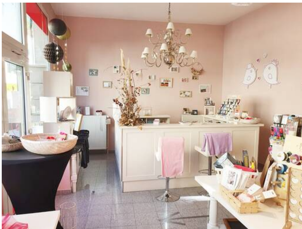
Verkaufsfläche / Eingangsbereich 1 EG