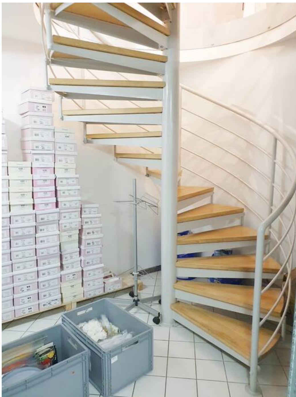
Zugang zum EG