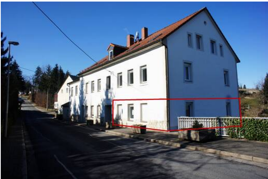
Lage der Wohnung