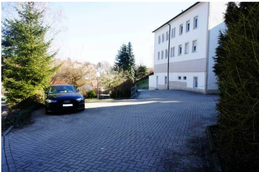
Zufahrt zum Grundstück